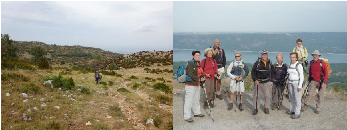
Le temps se charge, descente rapide sur Aiguines qui nous semble bien désert et vue sur son château