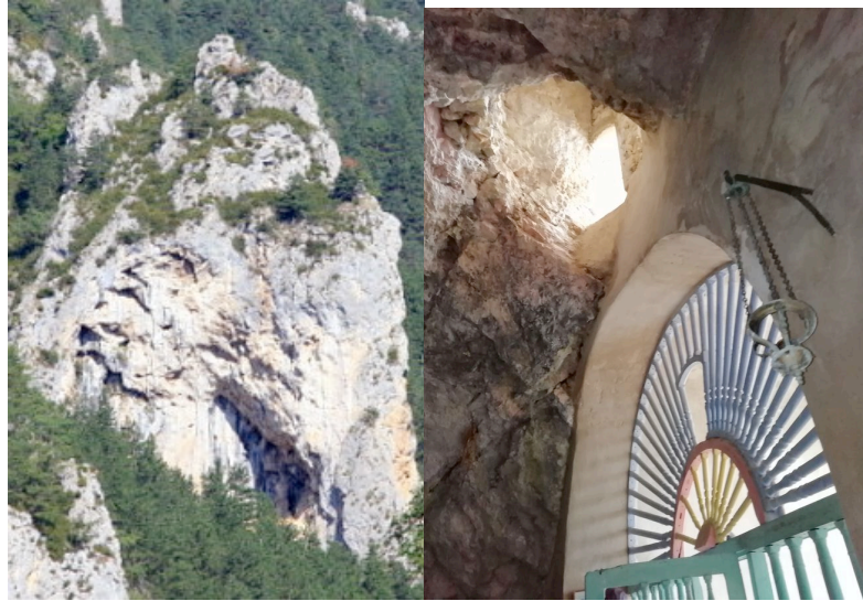
Trou du Diable (Aiglun) et brèche dans plafond à la Balme !!!

On raconte aussi qu'un ermite se serait réfugié à la chapelle de La Balme non loin; il pouvait bénéficier tout à la fois de la présence d'eau, de fleurs, de miel et même d'une chèvre pour son lait. Le diable aurait alors voulu le déloger pour ne plus entendre les louanges au ciel, mais il dut y renoncer après qu'il eut perdu ses deux cornes l'une ouvrant une brèche dans le plafond de la grotte et l'autre quand il sortit par la cheminée.