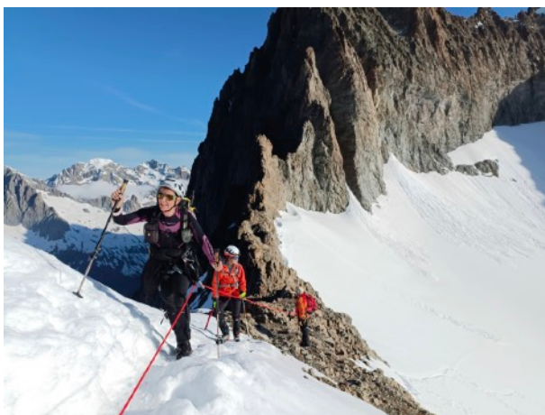
Col du Sélé (3283m)