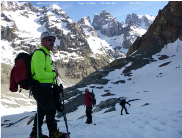
Un dernier regard en quittant la neige,

Puis la descente devant l'Ailefroide et le Pelvoux.