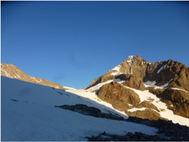
Passage devant l'Ailefroide.