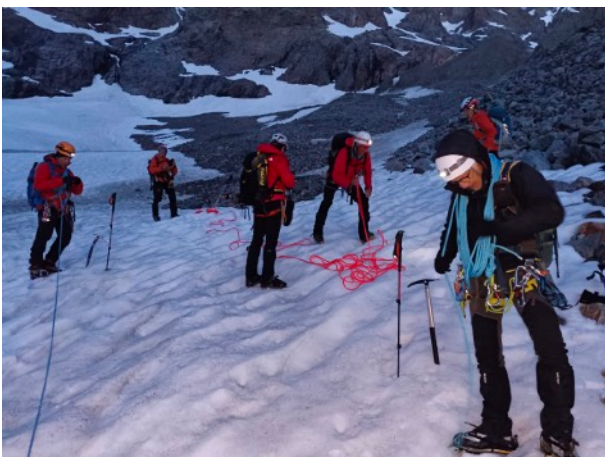
Cette fois les conditions sont bonnes. Lever 3h. Le ciel est clair. Départ avant 4h. Après environ une heure de marche sur la moraine, nous nous encordons sur le glacier.