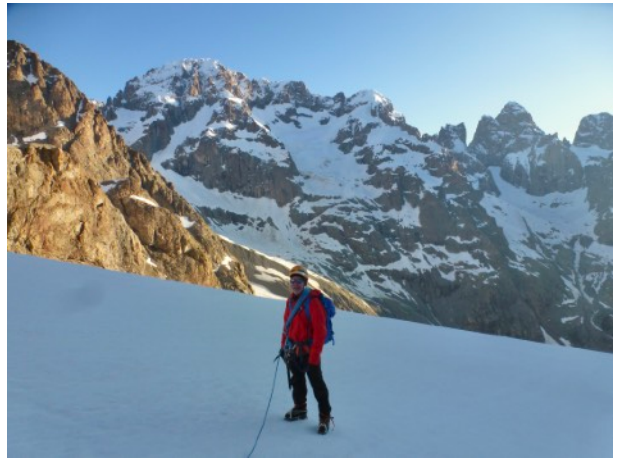
Une montée tranquille vers le col du Sélé.