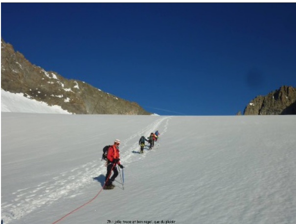
Et c'est le final