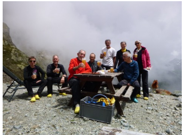
Et sa récompense