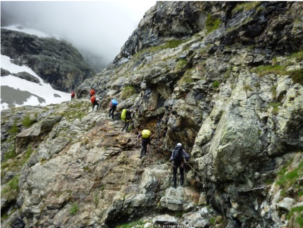
Et c'est l'arrivée au refuge du Sélé.