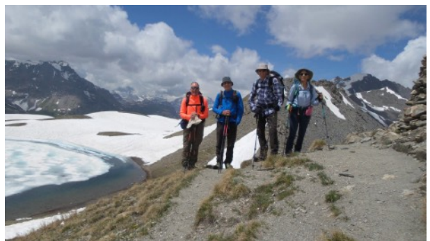
Puis c'est une descente en contournant les névés