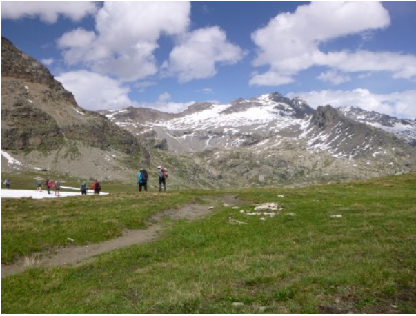
Refuge du Carro 2760m