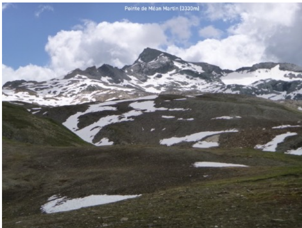
Avec la Pointe de Méan Martin qui se découvre