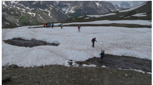
avant de franchir quelques névés près du col.