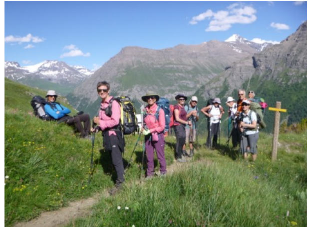
avant de monter dans les alpages