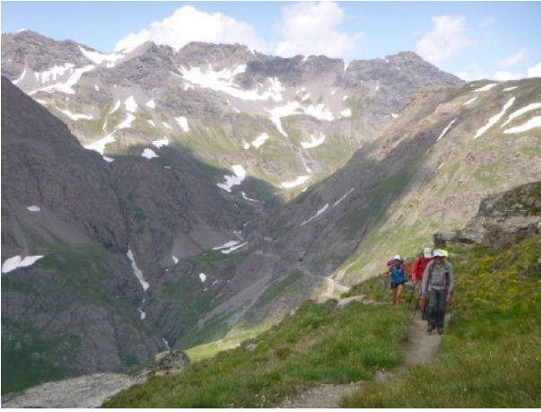
Du col on prend le sentier en balcon qui mène au refuge du Carro