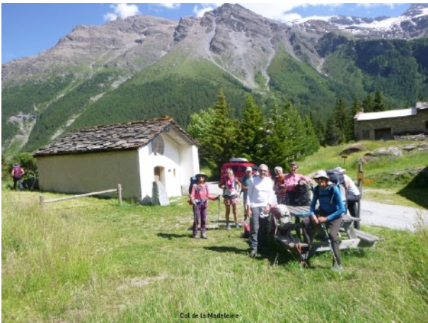
Trajet à l'horizontale de Bessans jusqu'au col de la Madeleine

C'est un premier jour classique, avec le départ de SLV tôt le matin pour Bessans en Haute-Maurienne. Le trajet retenu passe par le col de la Bonette, le col de Vars, Briançon, le col de Montgenèvre, Susa (It), le col du Mont Cenis.