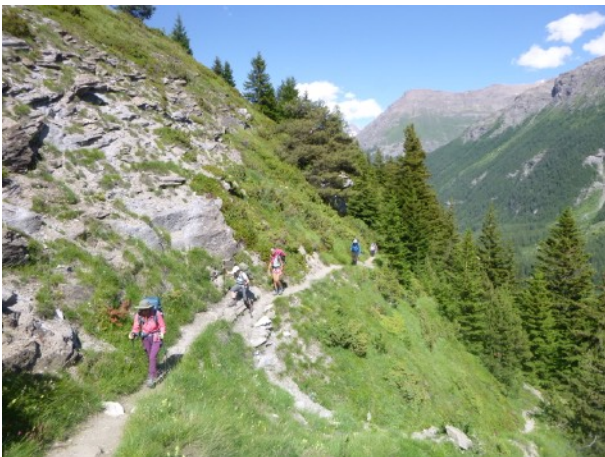
pour le refuge de Vallonbrun